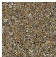
СВЕТЪЛ ПЯСЪК 004