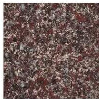
ТЪМЕН КЛИНКЕР 006