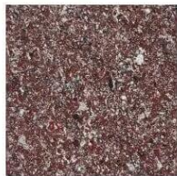
СВЕТЪЛ КЛИНКЕР 007