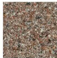
ТЪМЕН ПЯСЪК 005