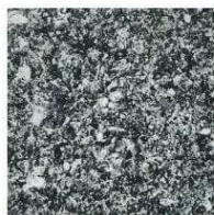
ТЪМЕН ГРАНИТ 001